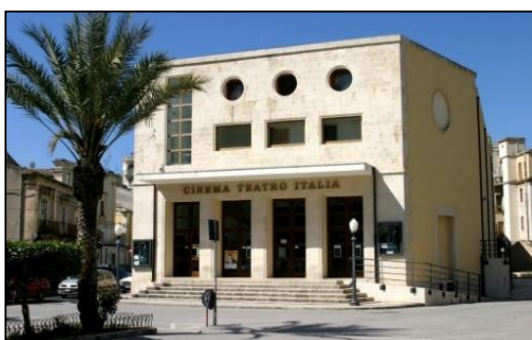
Teatro Italia Scicli

I vari complessi musicali secondo l'ordine prestabilito e pubblicizzato, si alterneranno sul palcoscenico per l'intero arco delle 2 giornate. Alla fine di tutte le esecuzioni, verranno scelte, da una Commissione, 10 scuole che verranno premiate nella serata finale e due migliori alunni per ogni gruppo.