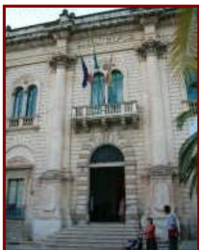
Palazzo del Comune, anche commissariato di Polizia di Vigata

L’intento di questa manifestazione è quello di far vivere a tutti i ragazzi partecipanti una grande festa dedicata alla Musica, in quanto la musica viene recepita dai giovani anche come momento di confronto e, al tempo stesso, di aggregazione e socializzazione. L’apprendimento del linguaggio musicale, con l’uso di uno strumento facile, di testi didattici e di spartiti, contribuisce alla formazione generale e deve essere garantito quale parte del diritto allo studio. La musica educa a vivere in armonia nella società, in famiglia e con gli amici, consente di riconoscere le proprie potenzialità creative ed emozionali ed aver fiducia in se stessi (autostima); favorisce scambi di esperienze di gruppo, sviluppando ed ampliando le capacità espressive e di aggregazione sociale, educa alla tolleranza ed alla comunicazione non verbale. Ulteriore intendimento del Festival è quello di far conoscere ed apprezzare gli aspetti artistici e culturali di Modica e di Scicli e di tutto il territorio ibleo, Patrimonio Mondiale dell’UNESCO. Riteniamo importantissimo che anche ai ragazzi, oltre agli insegnanti, venga data la possibilità di visitare e conoscere la nostra splendida terra, tutti i più importanti siti della Provincia e i luoghi dove è stata girata la serie televisiva “Il Commissario Montalbano” .