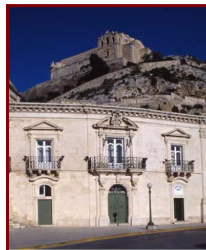
Palazzo Iacono e la chiesa di San Matteo Scicli